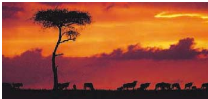
▲ Blick auf den Kilimanjaro